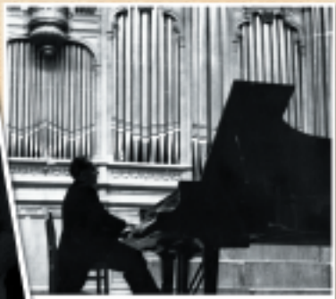
Recital in Grand Hall of Moscow conservatory. 1960s